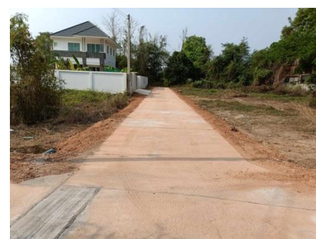
โครงการก่อสร้างถนนคอนกรีตเสริมเหล็ก ซอย 6 จำนวน 3 จุด หมู่ที่ 11 บ้านปากทาง ต.ชัยจุมพล