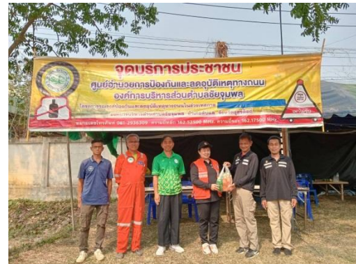
โครงการรณรงค์ป้องกันและลดอุบัติเหตุทางถนนในช่วงเทศกาล