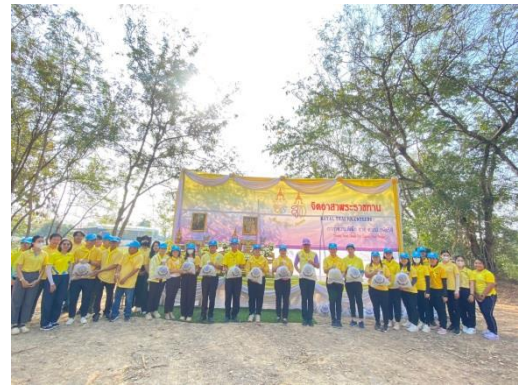
โครงการจิตอาสา “เราทำความดี ด้วยหัวใจ”