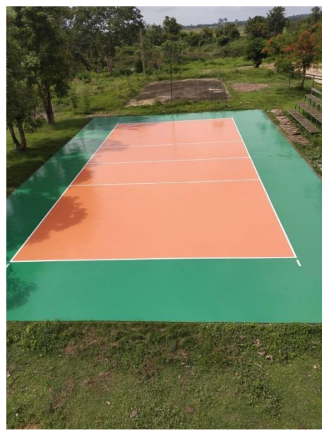
โครงการปรับปรุงพื้นที่ผิวสนามฟุตบอลและสนามวอลเลย์บอล