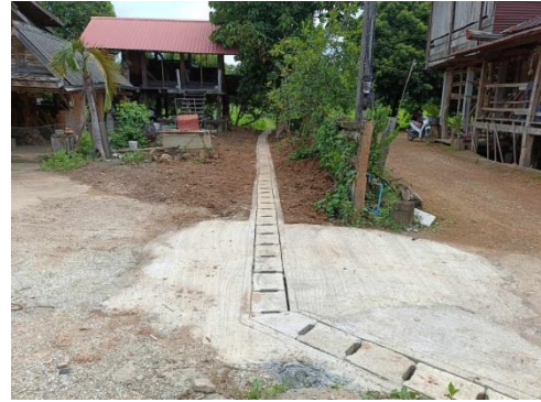
โครงการก่อสร้างรางระบายน้ำคอนกรีตเสริมเหล็ก ซอยบ้านนายส่ง จรรยา หมู่ที่ 5 บ้านนาทะเล