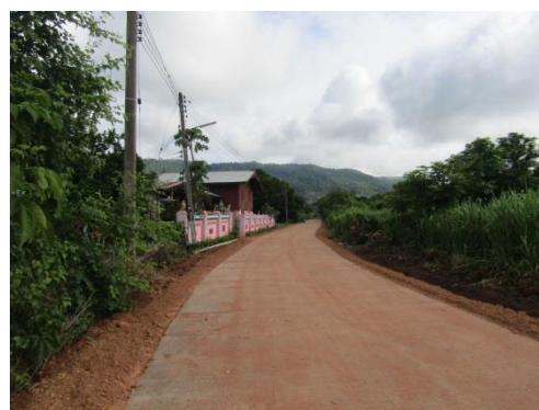
โครงการก่อสร้างถนนคอนกรีตเสริมเหล็กสายห้วยลาด (ต่อยอด)หมู่ที่ 6 บ้านชำป่าห้วย ตำบลชัยจุมพล อำเภอลับแล จังหวัดอุตรดิตถ์