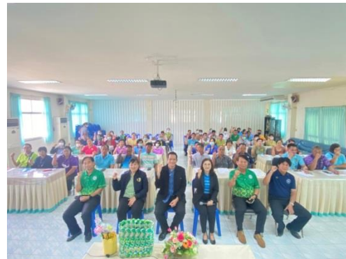
โครงการตำบลชัยภูมิพลสะอาดตามแนวทางประชารัฐ โดยใช้หลักการ 3 Rs