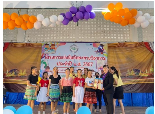
โครงการแข่งขันทักษะวิชาการ ประจำปี 2567