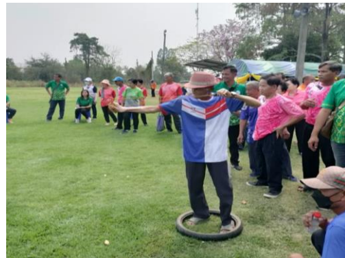
โครงการแข่งขันกีฬาและนันทนาการผู้สูงอายุ