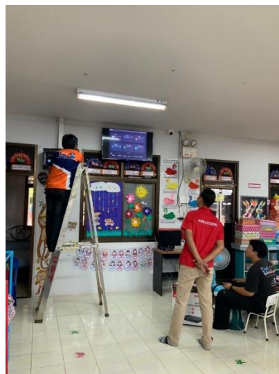
ติดตั้งระบบกล้องวงจรปิดศูนย์พัฒนาเด็กเล็กโรงเรียนวัดน้ำใส