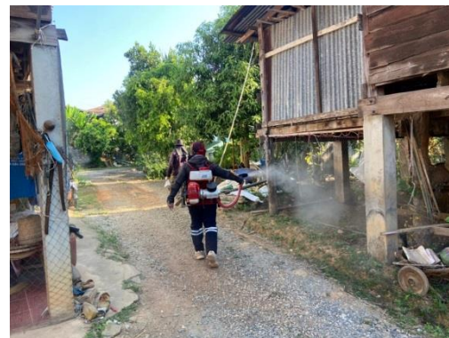
โครงการรณรงค์ป้องกันการแพร่ระบาดของโรคไข้เลือดออกในเขต ต.ชัยภูมิพล