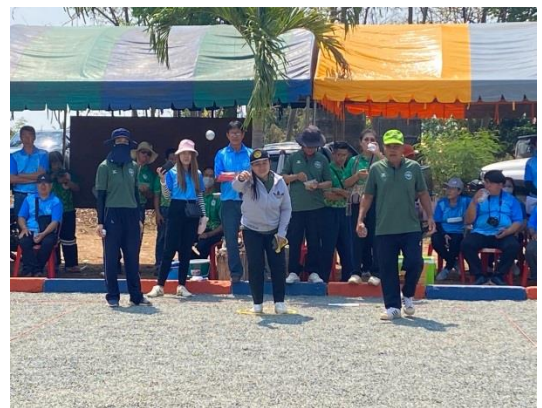
โครงการแข่งขันกีฬา อปท.ลับแล สัมพันธ์