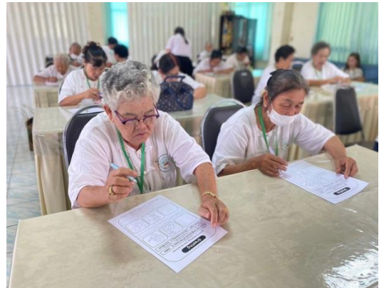
โครงการส่งเสริมการเรียนรู้สำหรับผู้สูงอายุและบุคคลที่เข้าสู่วัยผู้สูงอายุ ประจำปีงบประมาณ พ.ศ. 2567