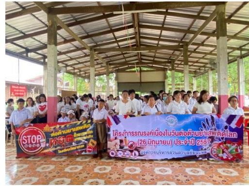
โครงการรณรงค์เนื่องในวันต่อต้านยาเสพติดโลก(26 มิถุนายน)