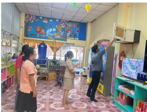
ติดตั้งระบบกล้องวงจรปิดศูนย์พัฒนาเด็กเล็กโรงเรียนวัดนาทะเล