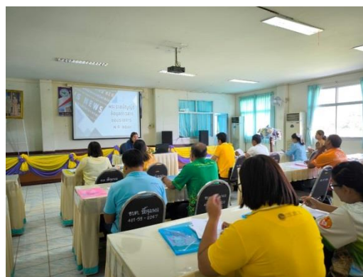
โครงการอบรมให้ความรู้ตามพระราชบัญญัติข้อมูลข่าวสารของทางราชการ พ.ศ.2540