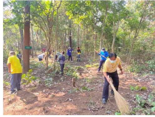
โครงการควบคุมป้องกันไฟป่า