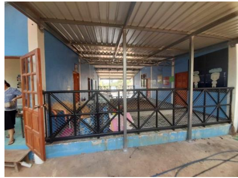
โครงการปรับปรุงต่อเติมอาคารศูนย์พัฒนาเด็กเล็กโรงเรียนวัดห้องสูง