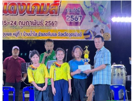
โครงการแข่งขันกีฬาตำบลชัยภูมิพล ประจำปี 2567