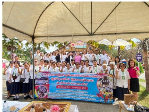
โครงการอบรมให้ความรู้เพื่อเสริมสร้างและพัฒนาศักยภาพผู้สูงอายุ/คนพิการ/ผู้ดูแล และผู้นำชุมชน